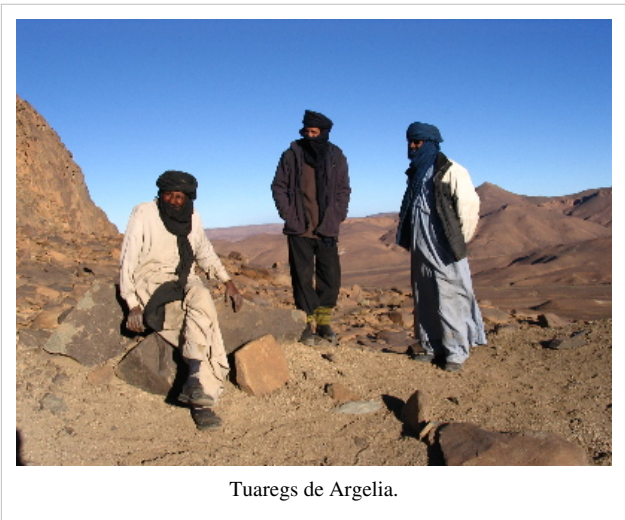
Tuaregs de Argelia.

El desarrollo de los medios de transporte modernos en el Sahara desde la segunda mitad del siglo XX ha provocado el declive de la actividad comercial de las caravanas tuareg y la sedentarización de parte de su población en las grandes ciudades del sur del desierto y del Sahel.